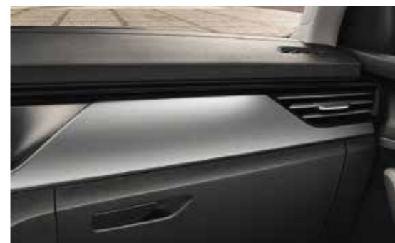
SREBRNI "HAPTIC" DEKORATIVNI ELEMENTI / CRNI "HOTSTAMPING" (za verziju Ambition)