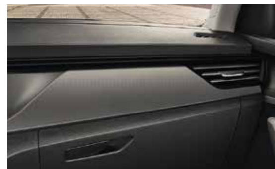
CRNI "GRAINED" DEKORATIVNI ELEMENTI / CRNI "HOTSTAMPING"