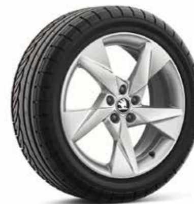
17" kotači od lakog metala VOLANS