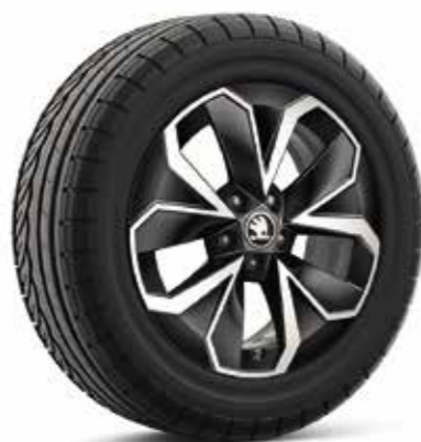
16" kotači od lakog metala HOEDUS AERO crne boje, polirani