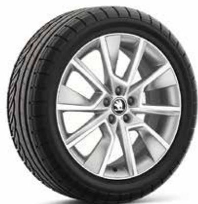
17" kotači od lakog metala BRAGA