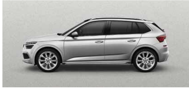
BRILLIANT SREBRNA METALIK