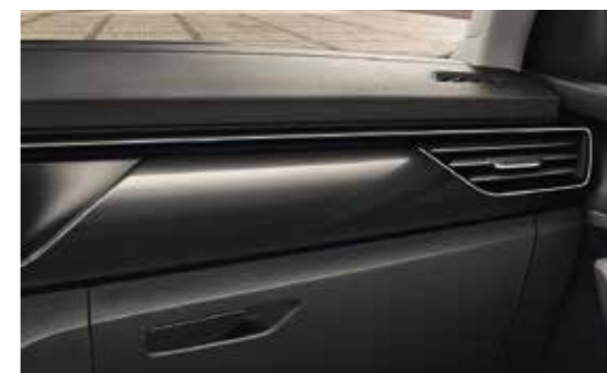
CRNI "DOTS" DEKORATIVNI ELEMENTI / KROMIRANI "HOTSTAMPING" (za verziju Style)