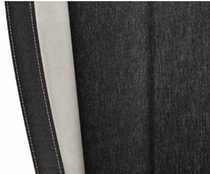
Style crna (tkanina/Suedia)