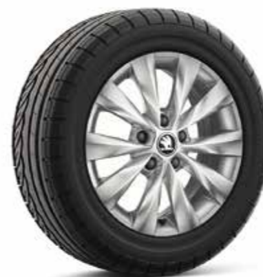
16" kotači od lakog metala CASTOR