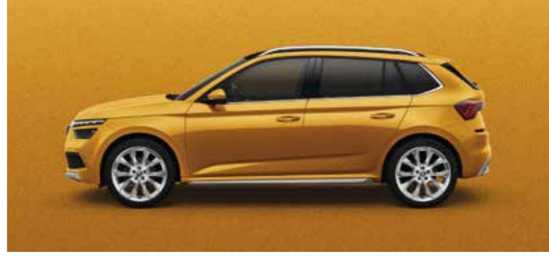
PHOENIX NARANČASTA METALIK