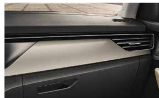
BEŽ "BRUSHED" DEKORATIVNI ELEMENTI / KROMIRANI "HOTSTAMPING"