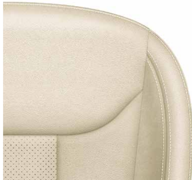
Style bež (koža/umjetna koža/Suedia)