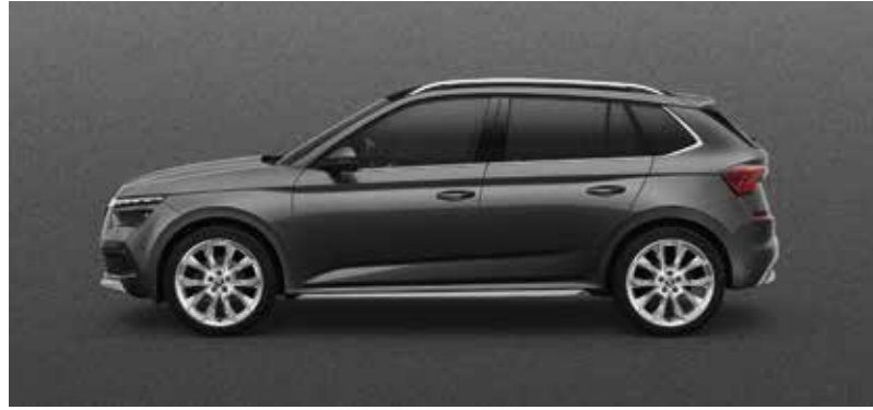
GRAPHITE SIVA METALIK

Molimo provjeriti dostupnost pojedinih boja kod ovlaštenih ŠKODA partnera.