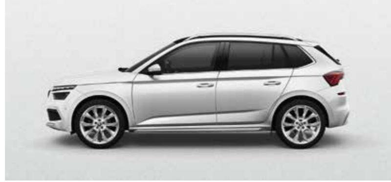
MOON BIJELA METALIK