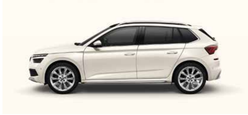
CANDY BIJELA UNI