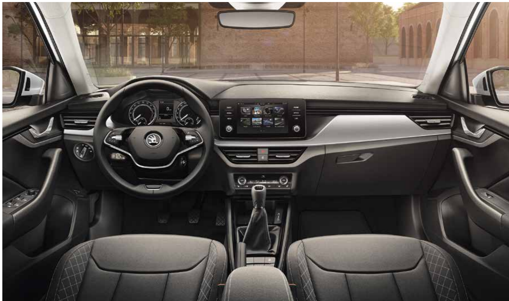
UNUTRAŠNJOST AMBITION CRNA Presvlake od tkanine