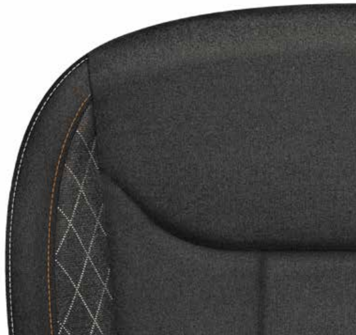
Ambition crna (tkanina)