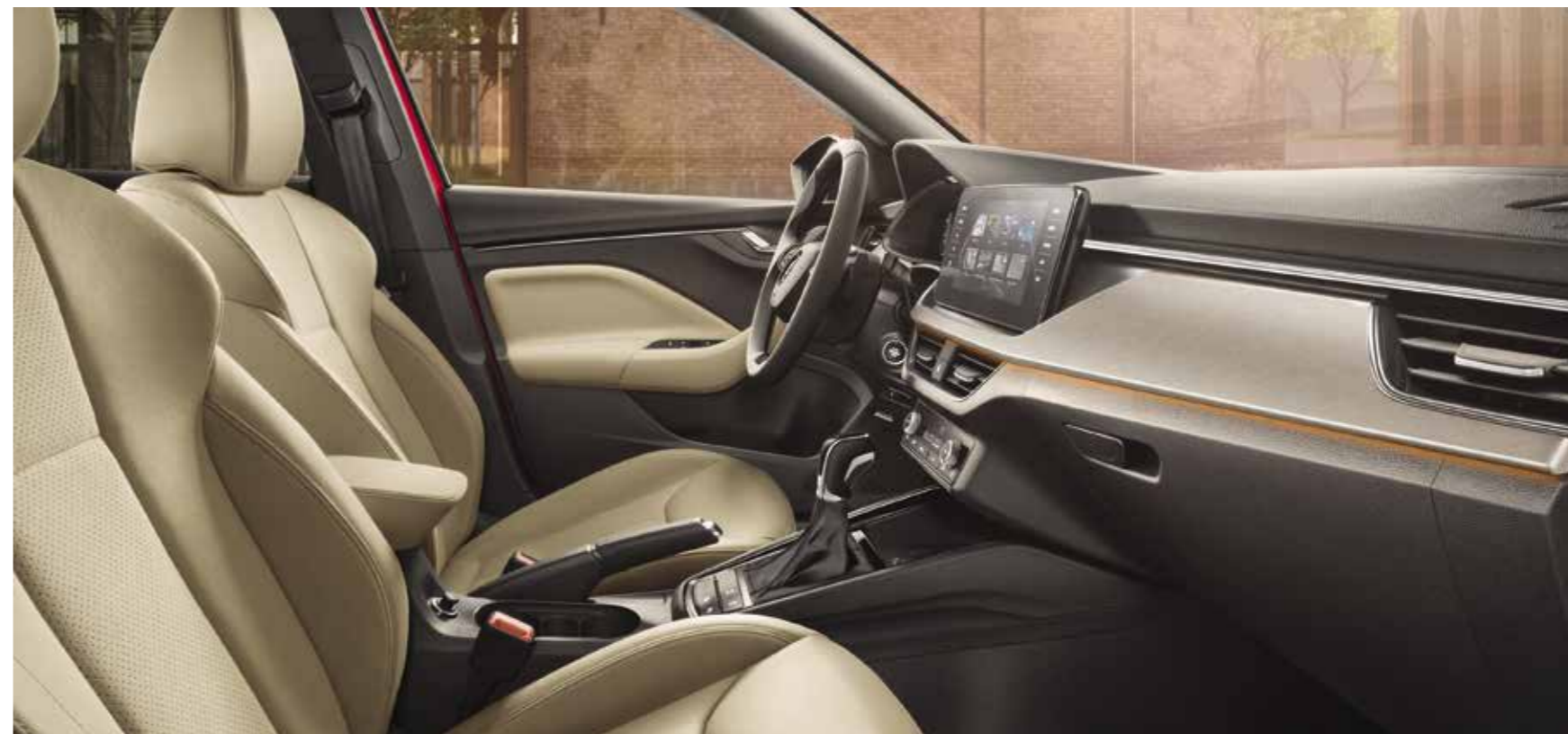
UNUTRAŠNJOST STYLE BEŽ Presvlake u kombinaciji koža/umjetna koža/Suedia