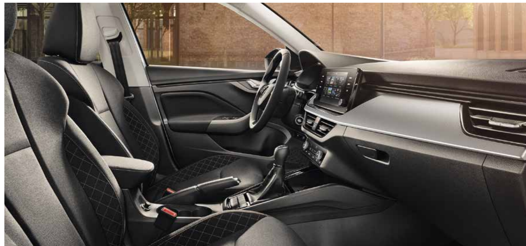
UNUTRAŠNJOST AMBITION CRNA Presvlake od tkanine