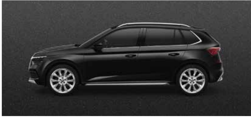
MAGIC CRNA METALIK