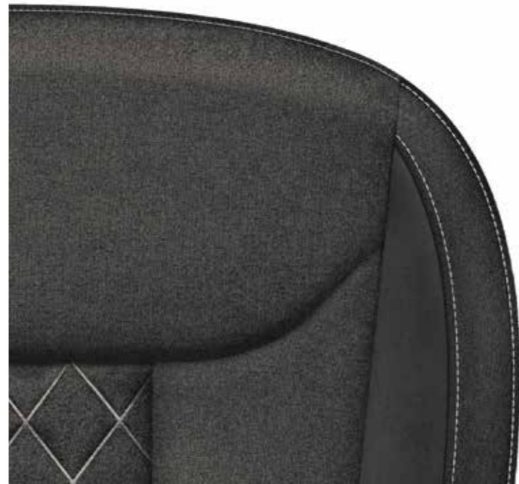
Ambition/Style sportska sjedala (tkanina/Suedia)