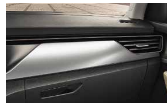
SIVI "LATTICE" DEKORATIVNI ELEMENTI / BAKRENI "HOTSTAMPING"