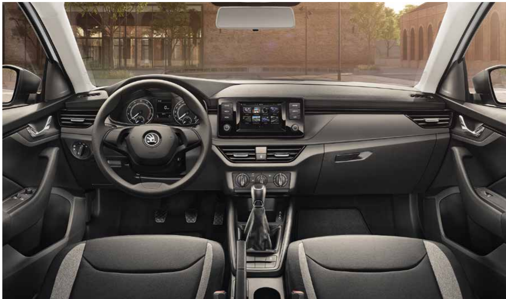
UNUTRAŠNJOST ACTIVE CRNA Presvlake od tkanine