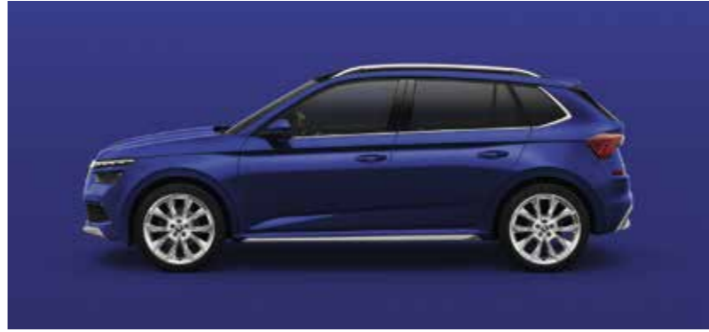
ENERGY PLAVA UNI