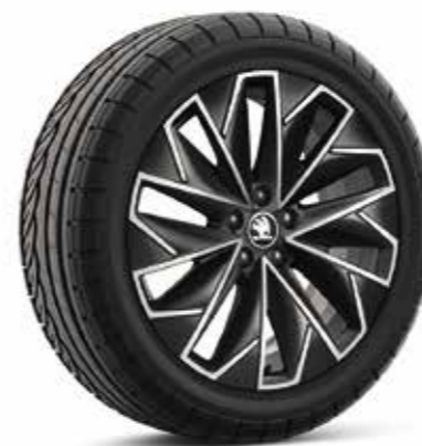
17" kotači od lakog metala PROPUS AERO crne/srebrne boje, polirani