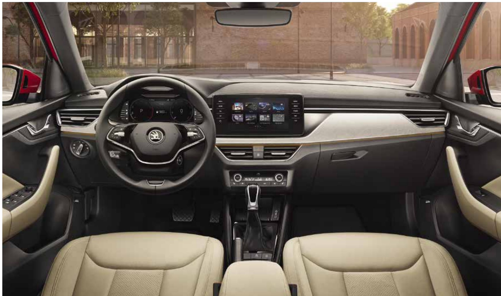
UNUTRAŠNJOST STYLE BEŽ Presvlake u kombinaciji koža/umjetna koža/Suedia