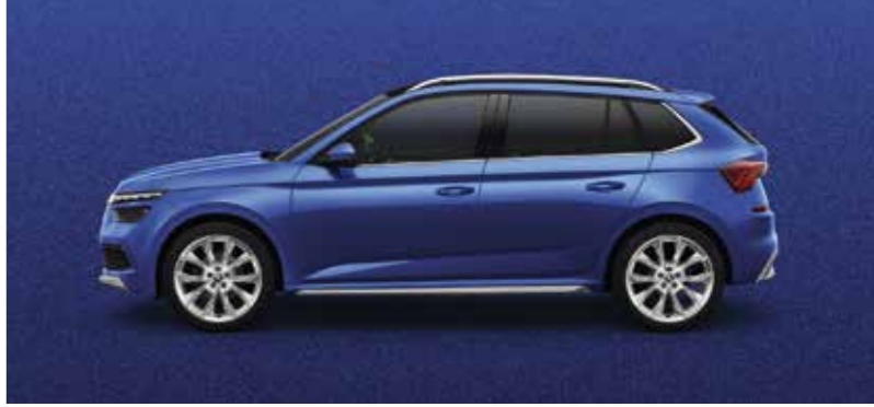
RACE PLAVA METALIK

Molimo provjeriti dostupnost pojedinih boja kod ovlaštenih ŠKODA partnera.