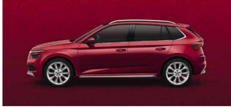
VELVET CRVENA METALIK