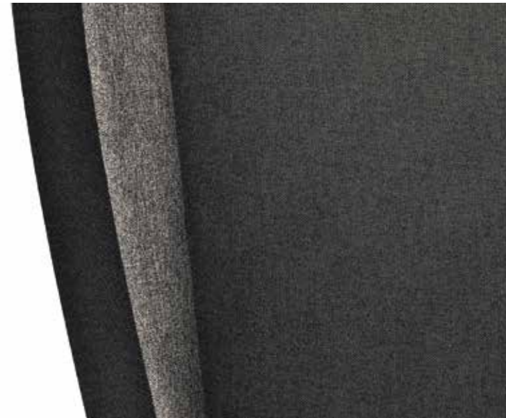
Active crna (tkanina)