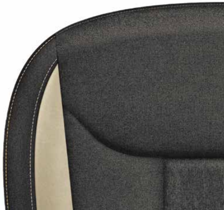
Style bež (tkanina/Suedia)