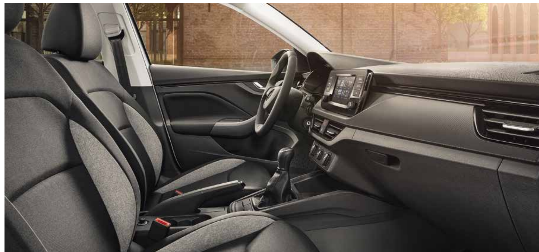
UNUTRAŠNJOST ACTIVE CRNA Presvlake od tkanine