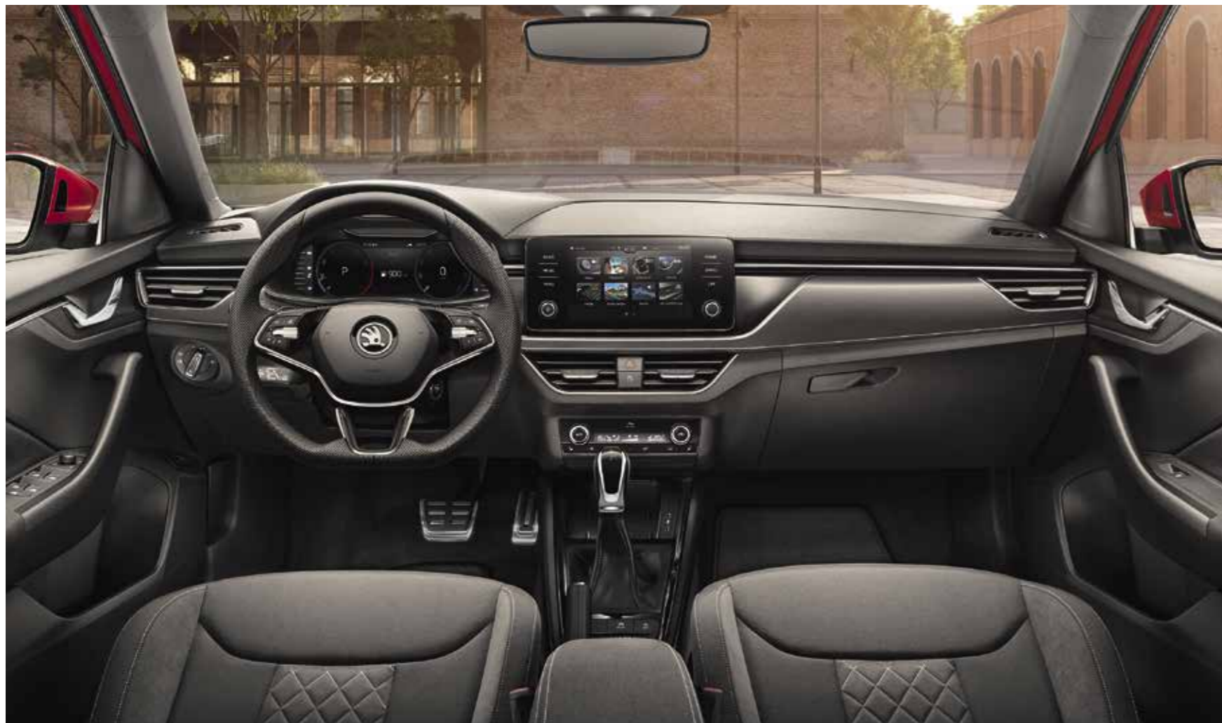
UNUTRAŠNJOST DYNAMIC Presvlake u kombinaciji tkanina/Suedia

Paket Dynamic dostupan u dodatnoj opremi za verzije Ambition i Style uključuje sportska sjedala, višenamjensko sportsko kolo upravljača, obloge papučica od plemenitog čelika i crnu krovnu oblogu.