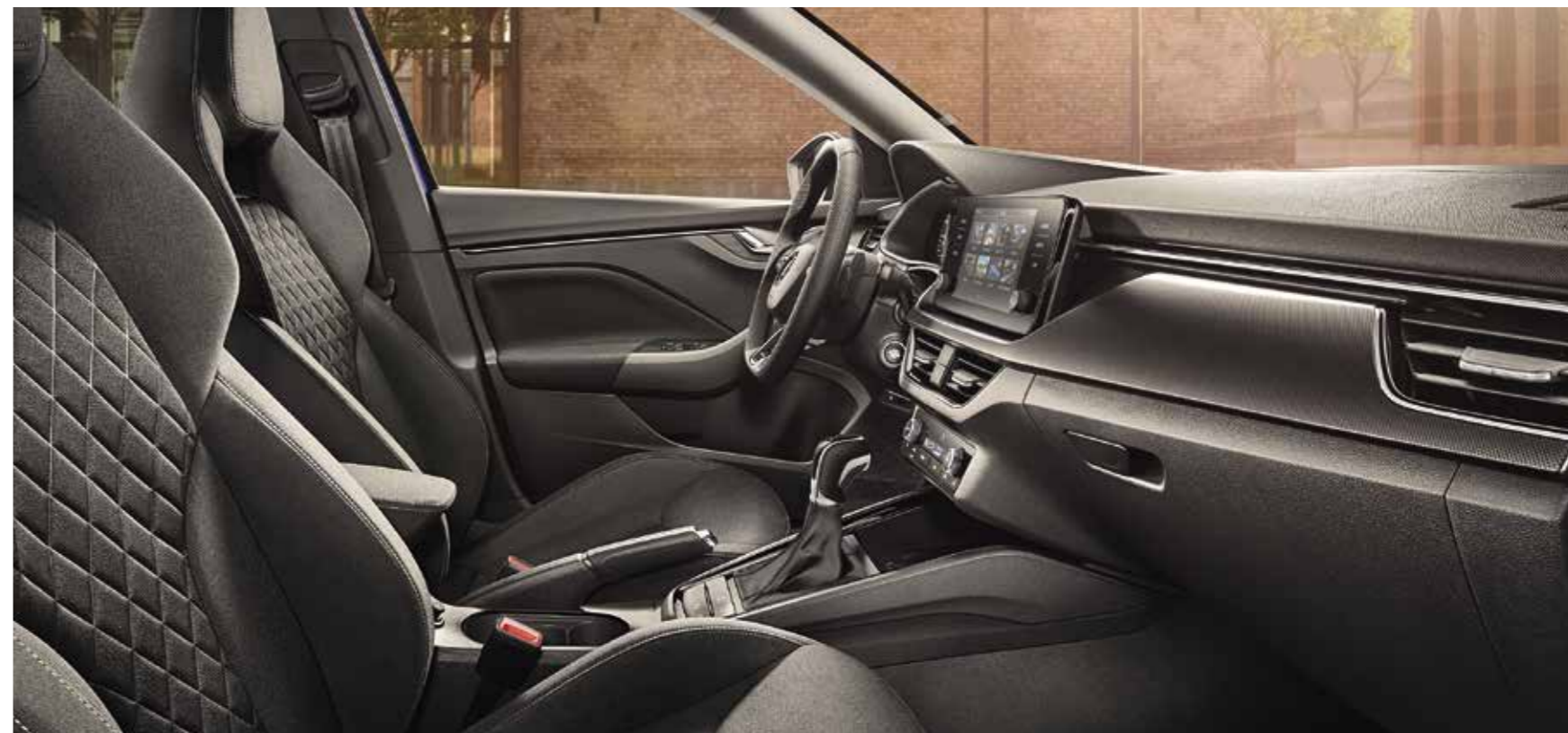
UNUTRAŠNJOST DYNAMIC Presvlake u kombinaciji tkanina/Suedia