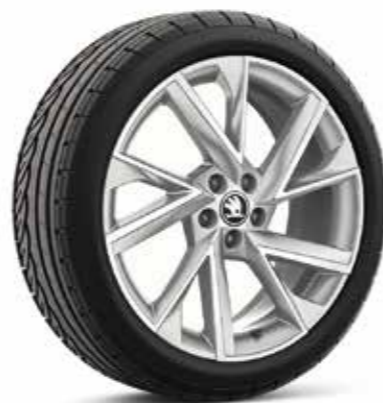
18" kotači od lakog metala VEGA